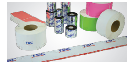
支持多元打印应用