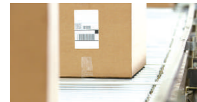
快速打印、省时省力