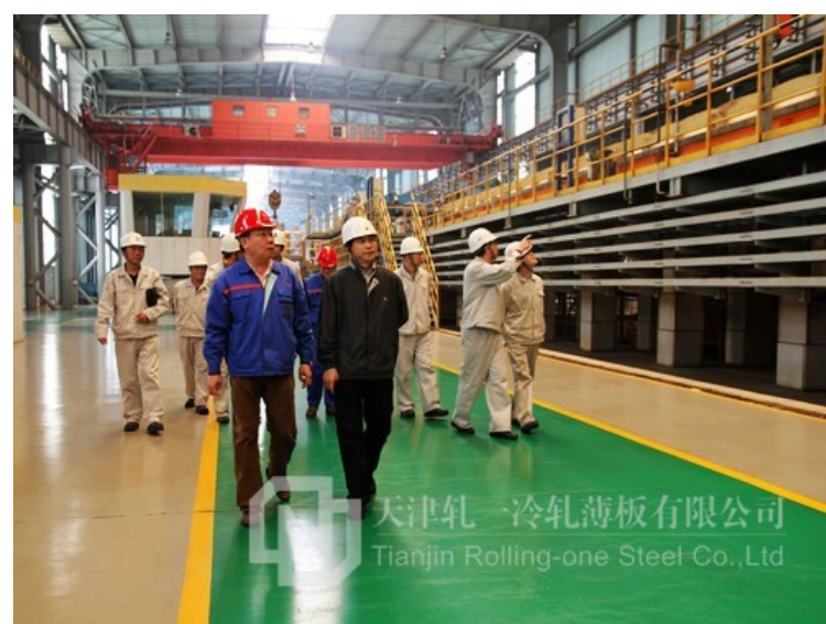
双方领导到车间现场参观