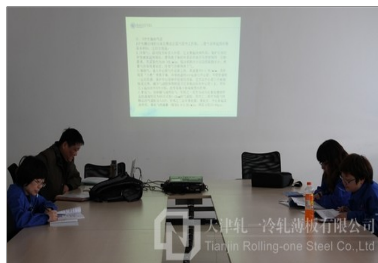
宝钢检化验专家 陈国明 授课