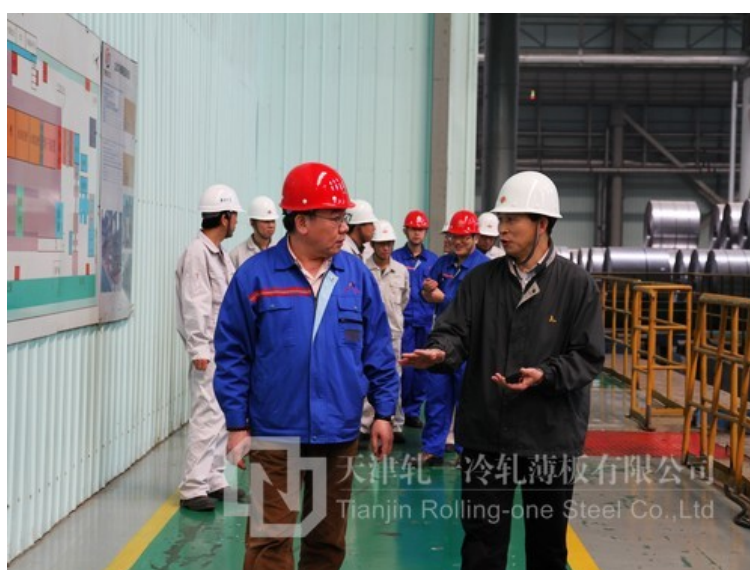
双方领导在车间现场沟通交流