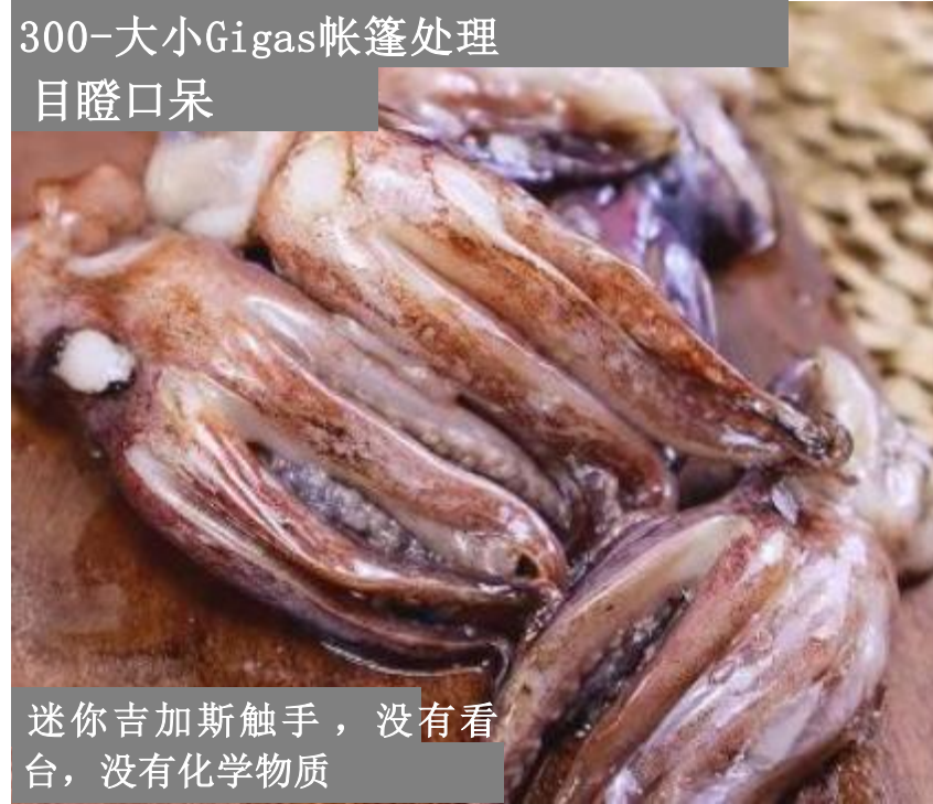
迷你吉加斯触手，没有看 台，没有化学物质