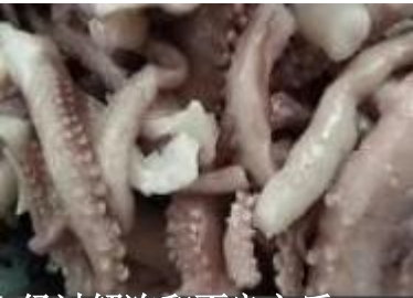
经过解冻和不良之后