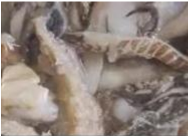
经过解冻后的不成形和不好的味道