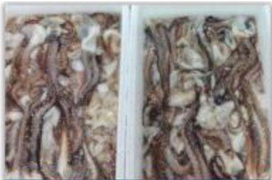
不含化学物质，不含闪光灯