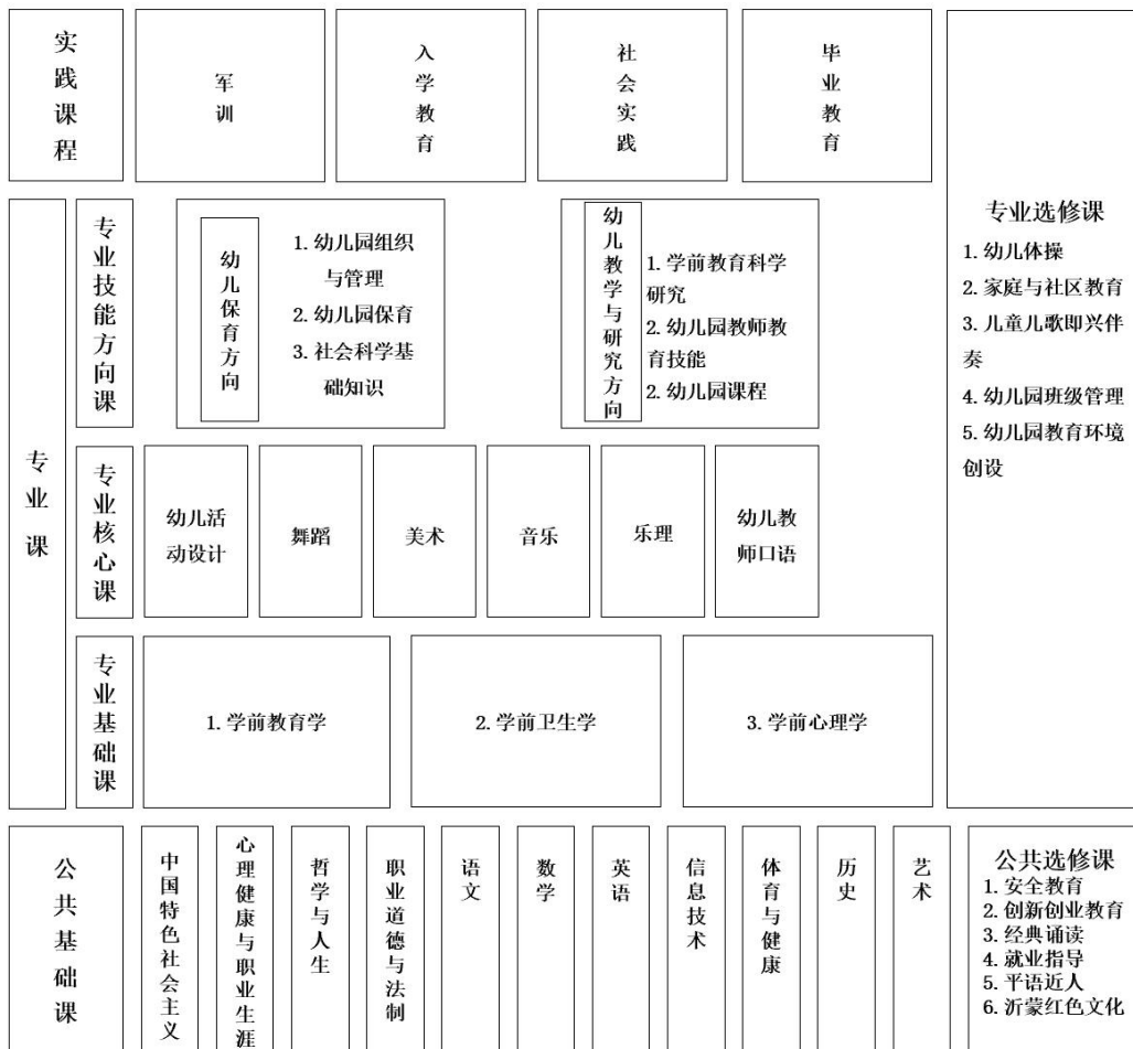
幼儿保育专业课程结构框架图