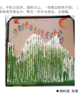
◆HR 王莹 ◆物料部 朱敏

5. 问：住院报销比例是多少？ 答：住院医疗费用先由个人按起付线标准支付，起付线标准以上、最高医疗费用限额以下的部分，由社会统筹基金和个人共同分担。起付线标准：一级医院（乡镇医院）：在职400元、退休300元。二级医院（人医、中医院）：在职500元、退休400元。三级医院（外地医院）：在职600元、退休500元。起付线以上的部分：1-10000元（含）统筹支付：在职85%、退休90%。10000-50000元统筹支付：在职90%、退休95%。50000-120000元统筹支付：在职、退休100%。120000-300000元统筹支付：在职、退休95%。300000元以上统筹支付：在职、退休40%。住院特殊病种医疗费用，个人支付起付线后，30万以内的限额内可结算费用全部由统筹基金支付；超过30万以上的限额内可结算费用由统筹基金支付40%。