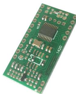
图 0.1 TX600QD 读卡模块