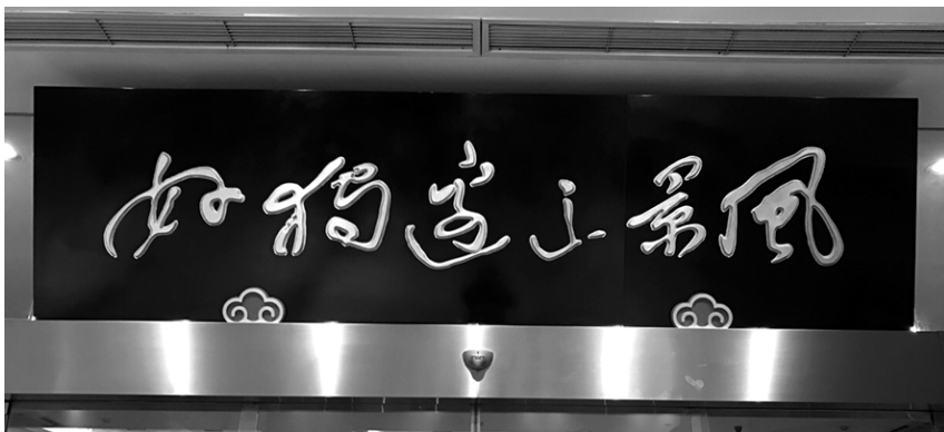
风景这边独好？好狗边上飘？

进去，所以谁都能称自己是书画家。所以肃竹也害怕不小心掉进去被打上书画家的标签了。