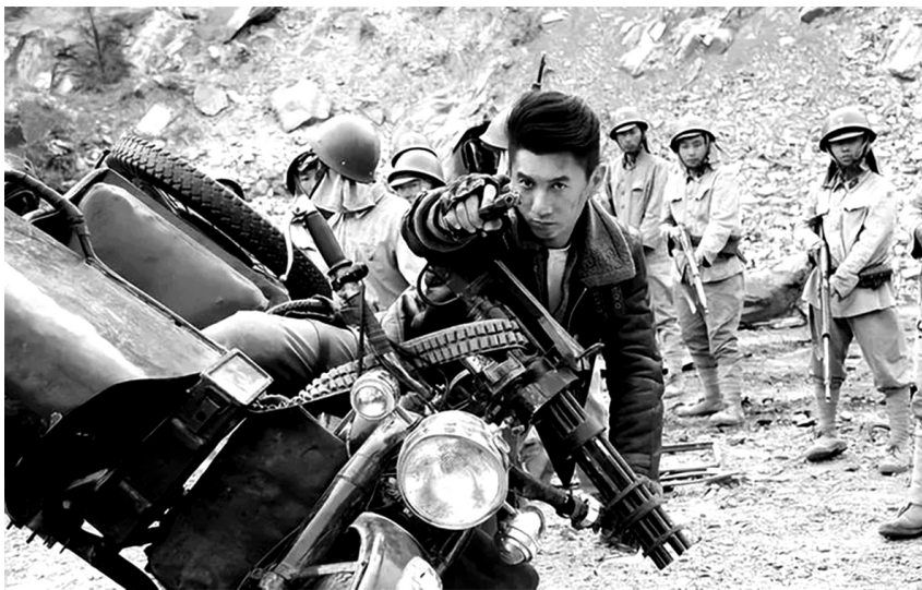
某抗战题材电视剧