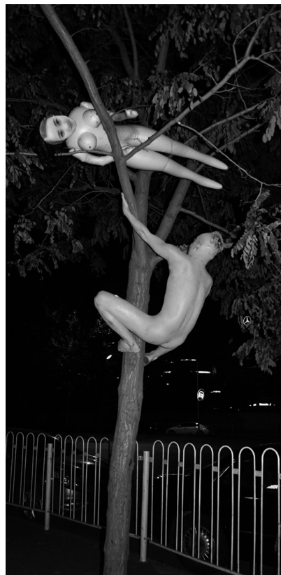
“行为艺术家”与充气娃娃裸奔